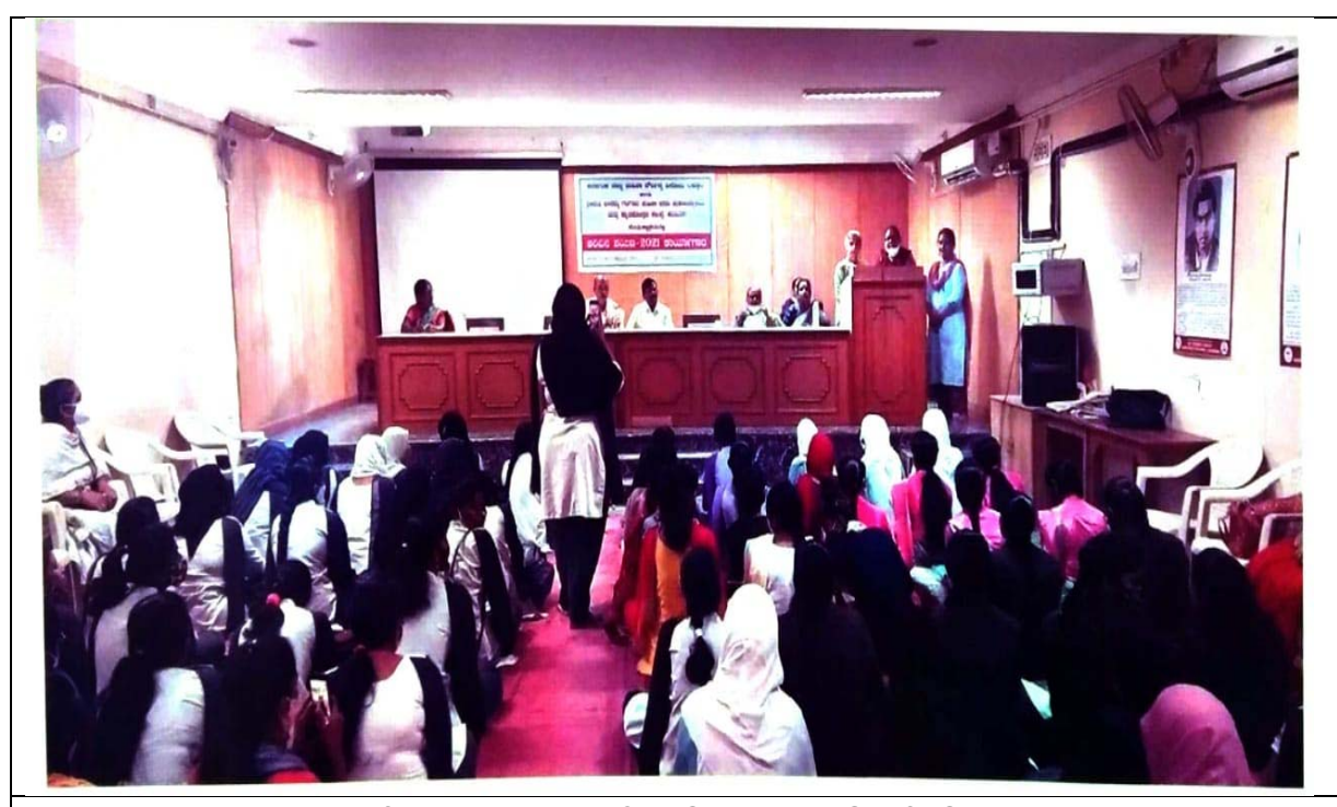
STUDENT INTERACTING AT THE WORKSHOP