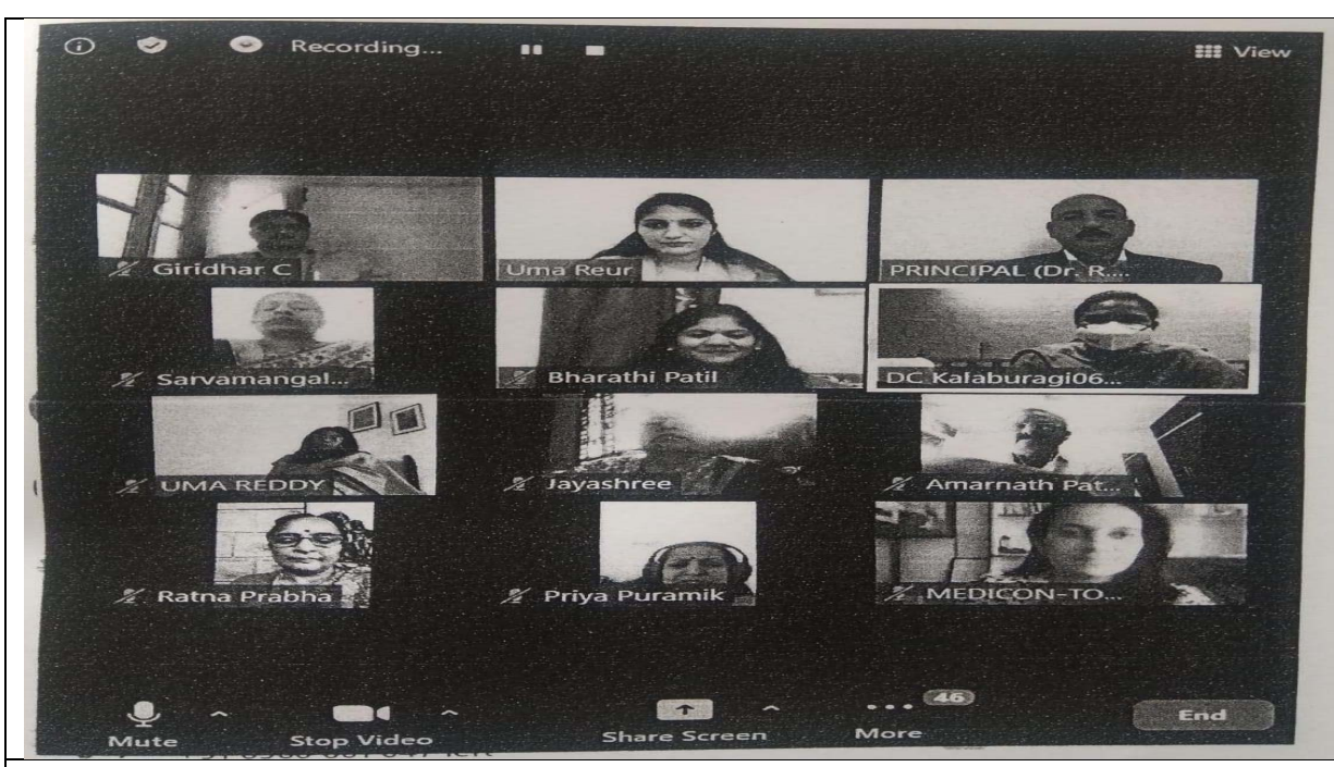
Smt VV Jyothsna, IAS,DC, giving the inaugural address