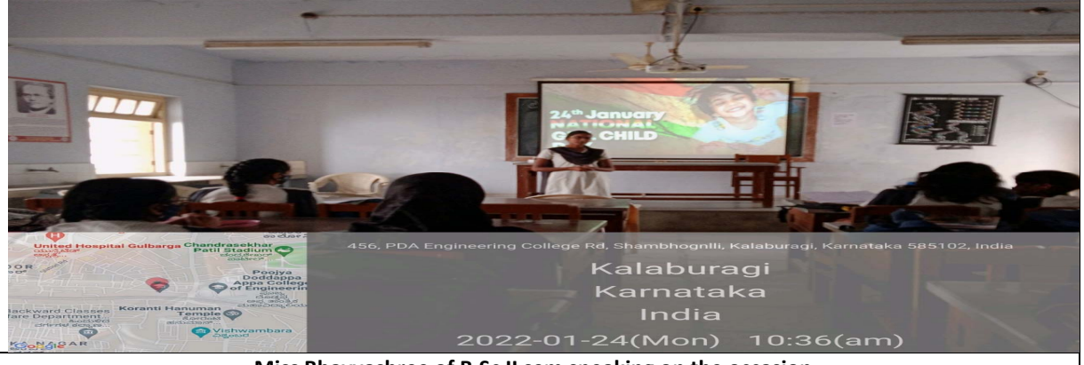
Miss Bhavyashree of B.Sc II sem speaking on the occasion.