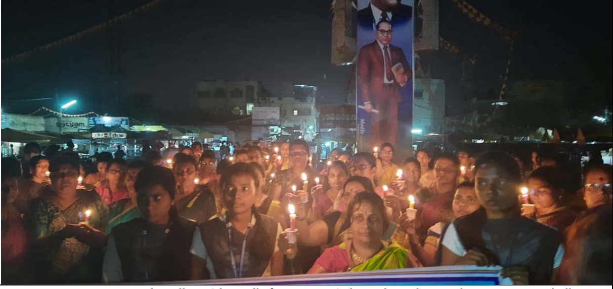
Calm ralley with candle from Jagat circle to Sharanbasaveshwar Centenary hall